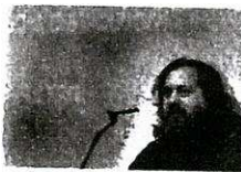
Dr. Richard Matthew Stallman Presidente de la Fundación de Software Libre (Free Software Foundation)